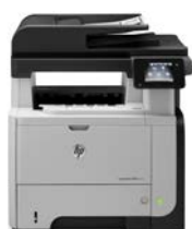
HP LaserJet Pro MFP M521dn