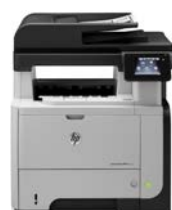
HP LaserJet Pro MFP M521dw