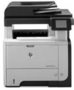
HP LaserJet Pro MFP M521dn