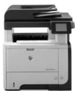
HP LaserJet Pro MFP M521dn