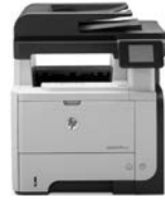
HP LaserJet Pro MFP M521dw