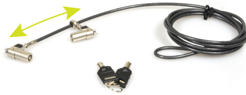
Ajustable second lock position Position du second verrou ajustable