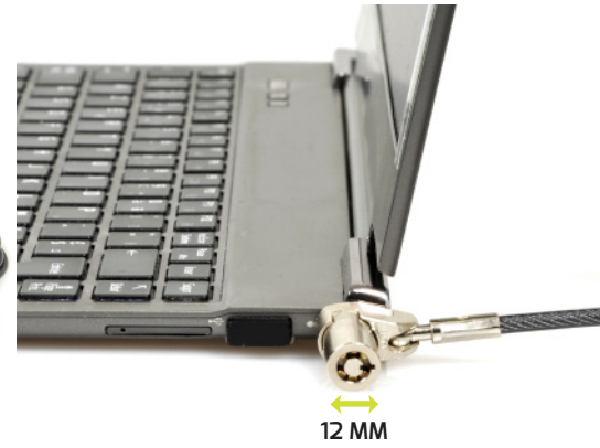
Ultra slim : adapted to slim notbooks and narrow ports Ultra slim : adapté aux PC fins et aux ports rapprochés