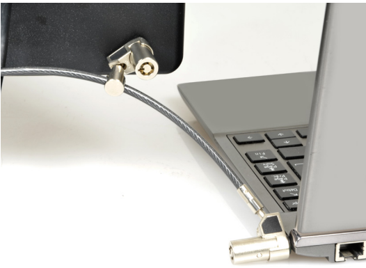
Secures 2 devices at once Protège 2 appareils à la fois

For ultrabook, laptop, desktop, monitor & other devices Pour ultrabook, ordinateur portable et de bureau, moniteur et autres appareils